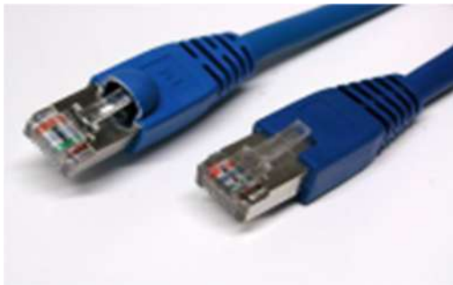
CAVO LAN L=30cm